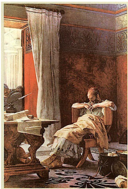
Archimède, par Niccolò Barabino (1860)