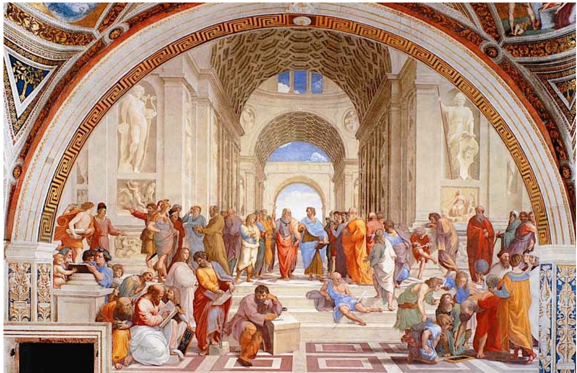
L'école d'Athènes, par Raphaël (1509-1512) – Musées du Vatican, Rome