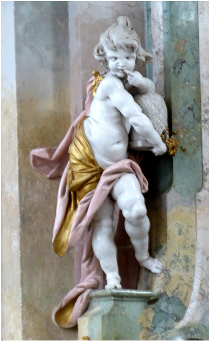
Église de Birnau, Putto "mangeur de miel" (symbole de l'éloquence de saint Bernard), 1750