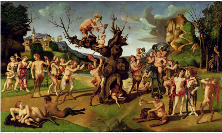
Piero di Cosimo, Bacchus découvrant le miel, vers 1500