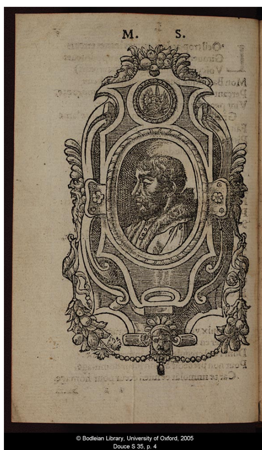
Illustration 1 : Portrait du poète Maurice Scève.

Maurice Scève (environ 1500-1560), humaniste et poète, publie en 1544, à Lyon, un recueil de poésie amoureuse : Délie, objet de plus haute vertu . Après sa mort, paraîtra Microcosme , un ouvrage qui allie poésie et philosophie. Les deux recueils ont permis aux universitaires d'établir que Maurice Scève était un lecteur de Jacques Lefèvre d'Étaples.