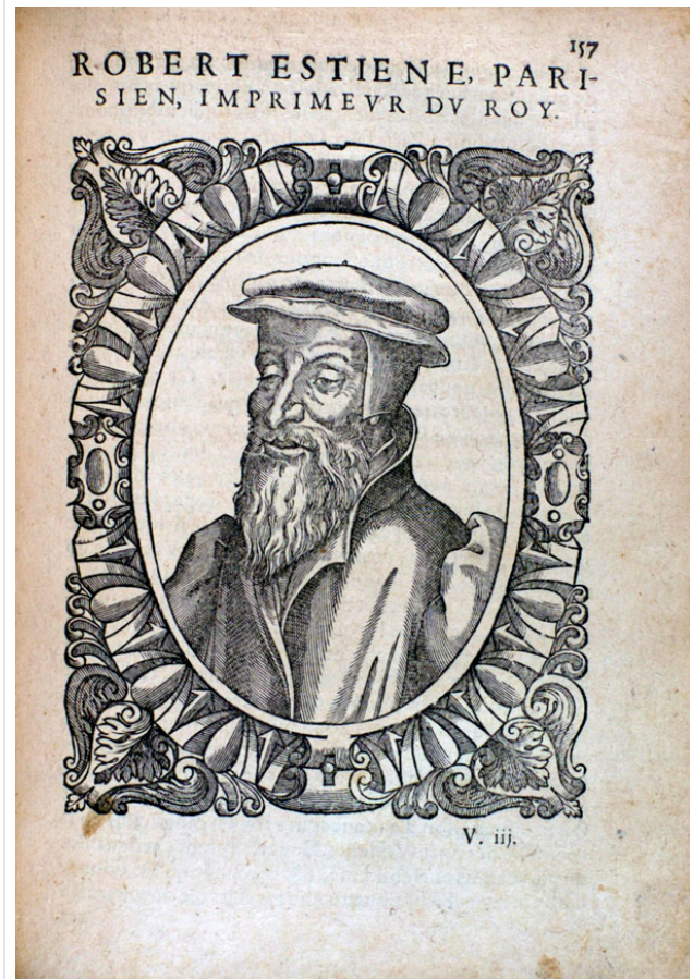
Illustration 3 : Robert Estienne dans Les vrais portraits des hommes illustres .