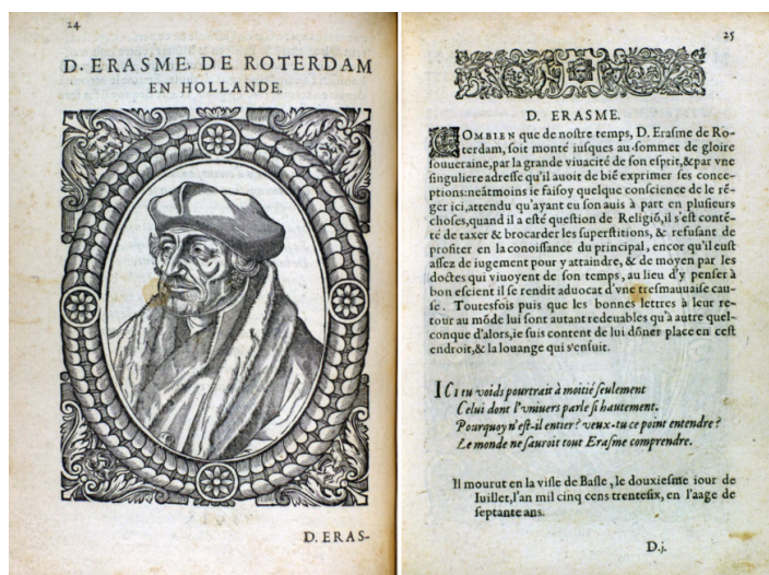
Illustration 1 : En face à face, portrait d'Érasme en image et en mots.

« Combien que de notre temps, D. Erasme de Rotterdam, soit monté jusques au sommet de gloire souveraine, par la grande vivacité de son esprit, et par une singulière adresse qu'il avait de bien exprimer ses conceptions ».