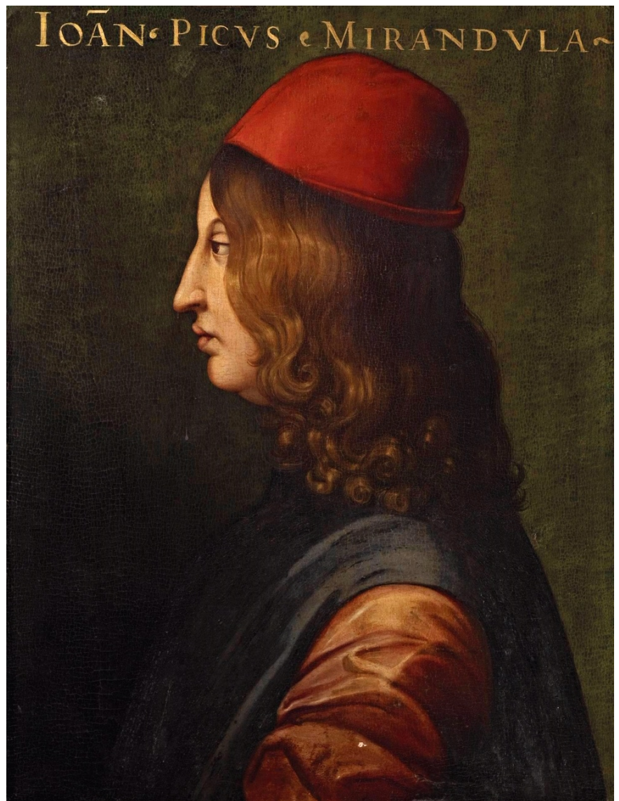
Portrait de Jean Pic de la Mirandole (Galleria degli Uffizi, Firenze).

Dans les années 1490, à son retour d'un voyage en Italie, Lefèvre d'Étaples commence à travailler au manuscrit de La Magie naturelle . Or ces années-là ne sont pas vraiment propices à un tel projet, puisque la magie, comme l'astrologie, sont interdites en France. En Italie, au cours de l'hiver 1491-1492, Jacques Lefèvre a rencontré Jean Pic de la Mirandole et Marsile Ficin, deux humanistes versés dans ces questions de magie, et s'inspire de leurs idées dans son propre livre. Lefèvre d'Étaples s'appuie également sur les auteurs antiques dans son traité.