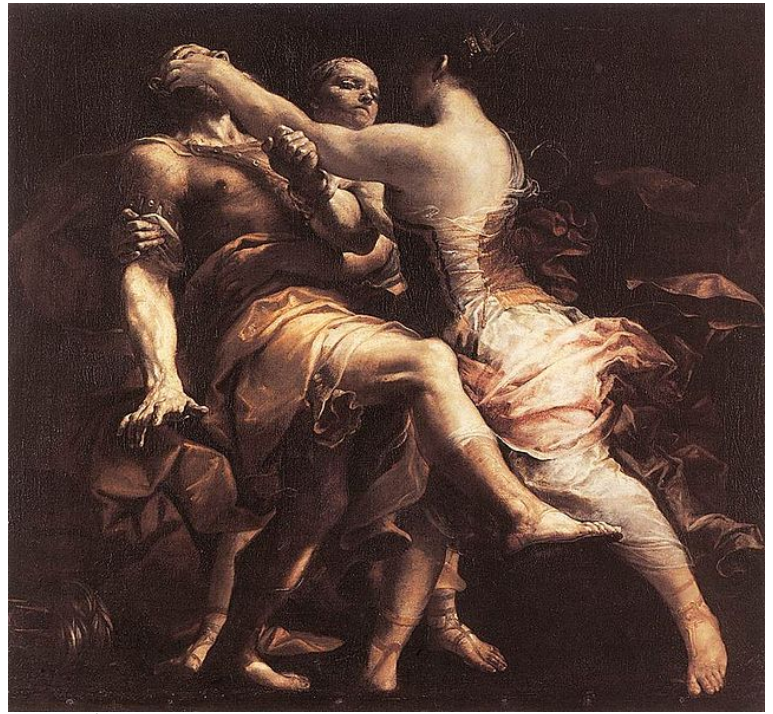
Crespi - Hécube tue Polymestor