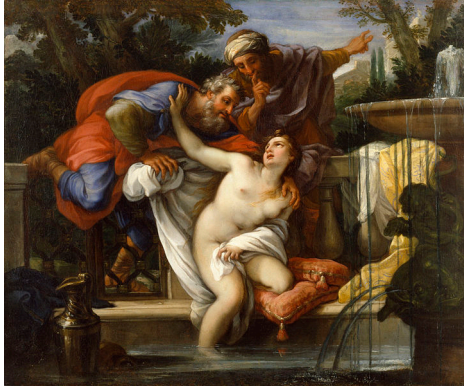
Suzanne et les vieillards, par Giuseppe Bartolomeo Chiari