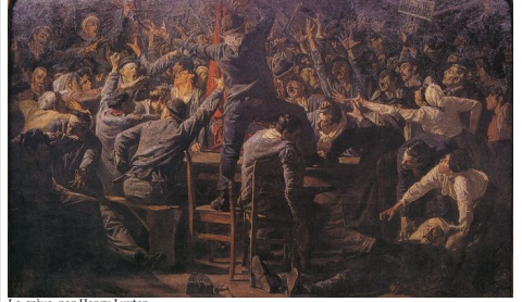
La grève, par Henry Luyten