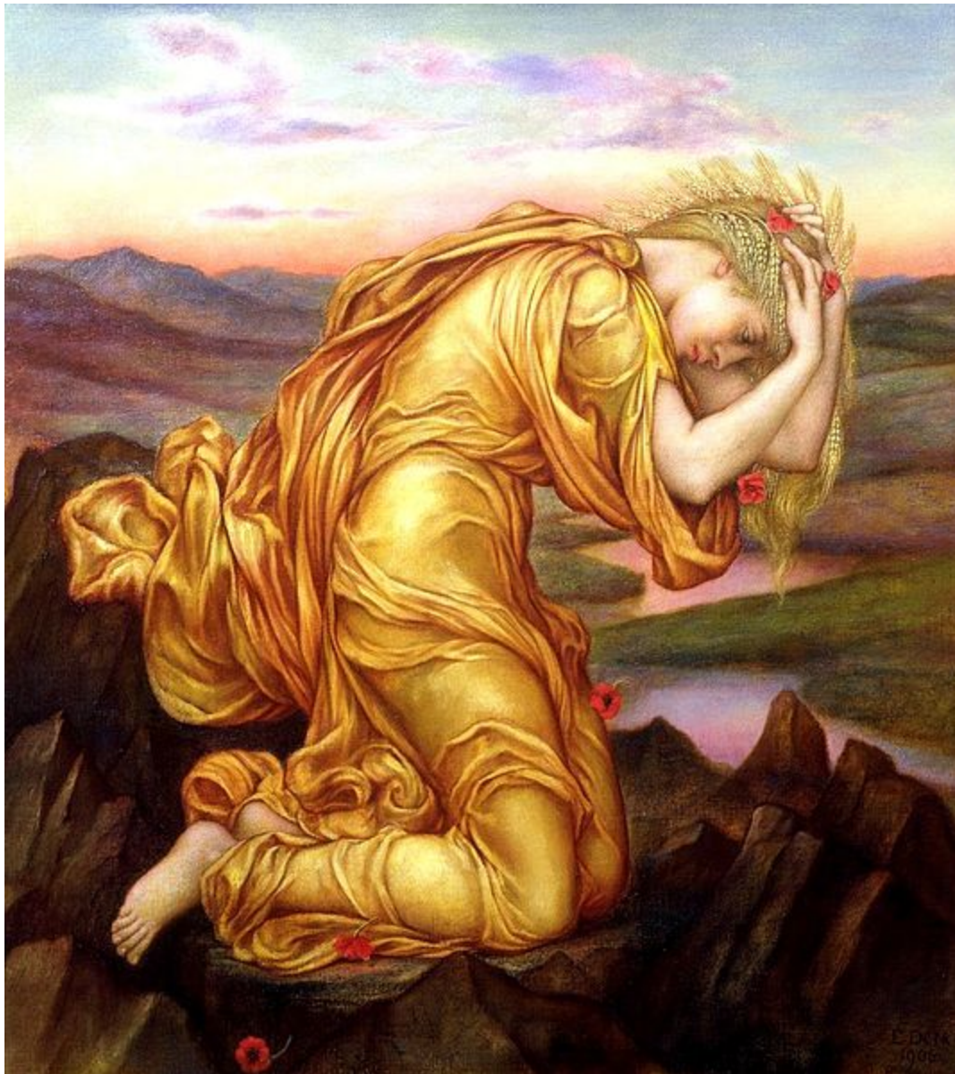
Déméter pleurant Perséphone, par Evelyn de Morgan

À celle qui a grandi sous le soleil de Sicile, dans l'odeur fraîche et vigoureuse des citronniers, l'absence de lumière est insupportable, comme celle de sa mère, comme celle de la vie. Et puis, elle est si jeune, et il n'y a que des vieux décrépits autour d'elle. Même les défunts les plus verts lui parlent de gens qu'elle n'a jamais connus. Quelle lassitude ! Quelle désolation ! Elle pleure, elle soupire, dépérit parmi les âmes, se meurt parmi les morts sans pouvoir mourir. Le pire vient lorsque de son palais, elle entend au-dessus d'elle les pleurs rauques de sa mère, Déméter, la déesse qui veille aux récoltes. Tout à son chagrin, elle n'a que faire des semailles si bien que sur Terre plus rien ne pousse. Au bout de quelque temps de ce traitement le monde d'en-haut, celui des vivants, ressemble de plus en plus à celui des morts. Sous le soleil et sous la terre, tous et toutes se lamentent.