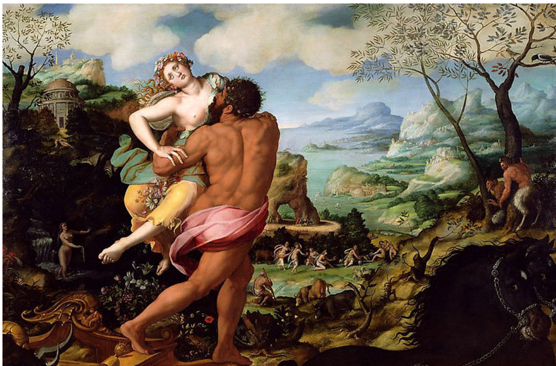
Le rapt de Proserpine, par Alessandro Allori

Le plan est parfait, divin même et donc rien ne se passe comme prévu.