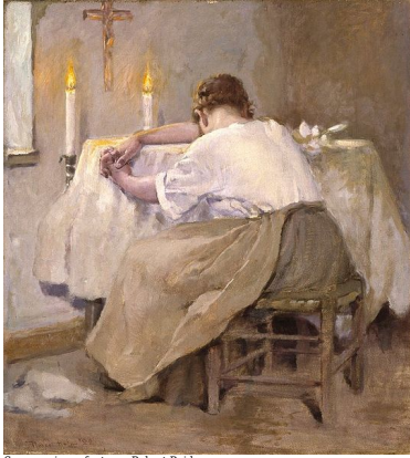
Son premier enfant, par Robert Reid